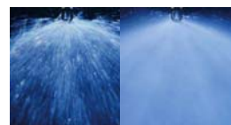
Comparativa de descarga de agua en un rociador tradicional y en una boquilla de EconAqua

La adecuación al riesgo y la eficacia de EconAqua se ha documentado y confirmado por VdS, a través de varios ensayos de fuego desarrollados bajo condiciones reales y reconstrucciones de edificios originales.